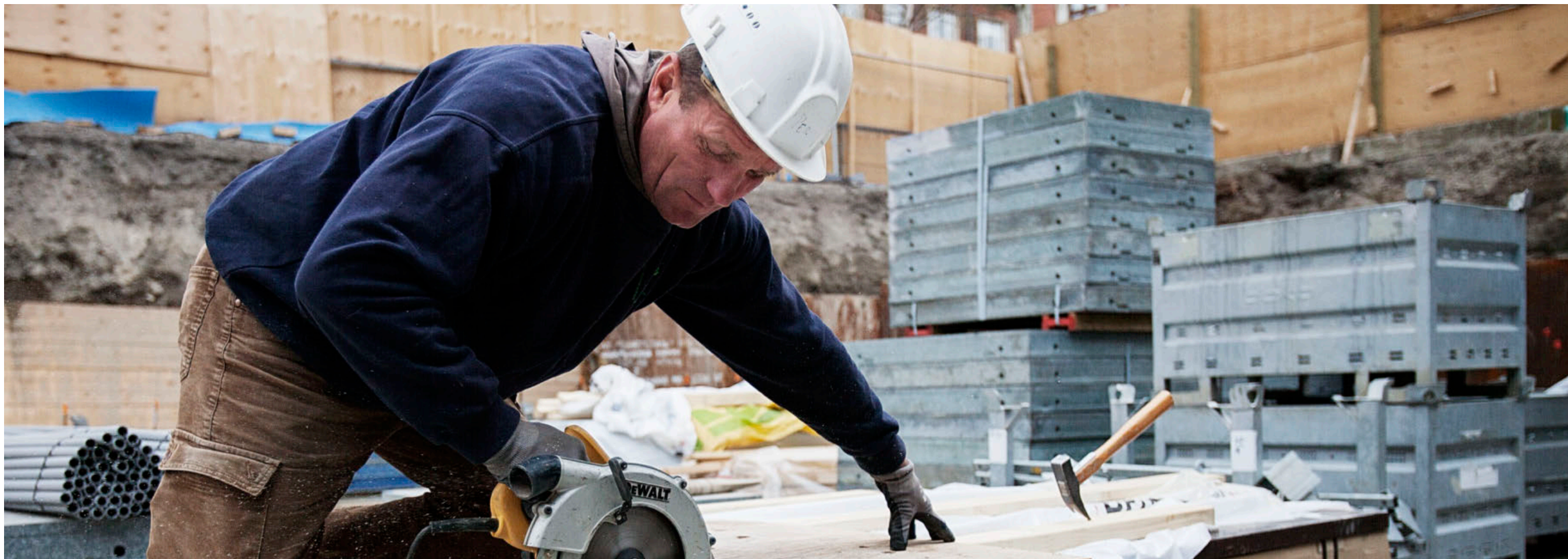
UDVIKLING. Lønnen for en gennemsnitlig lønmodtager er blot steget 3 procent siden 2009, når man renser for inflation.