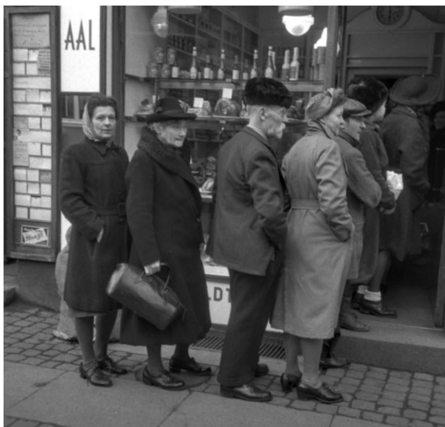
KØKULTUR. Køer er en del af tilværelsen. Generelt er reglen 'først til mølle', men hvornår gøres der egentligt undtagelser?

allerede i børnehaven gennem formaninger såsom »vent, til det bliver din tur«. Sædvanligvis er det sådan, at køen ni-