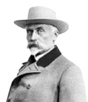
VIGGO HØRUP (1841-1902) STIFTER AF POLITIKEN I 1884

4 læserbreve og debatindlæg handlede om folkeskolen