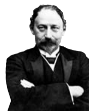
EDVARD BRANDES (1847-1931) STIFTER AF POLITIKEN I 1884